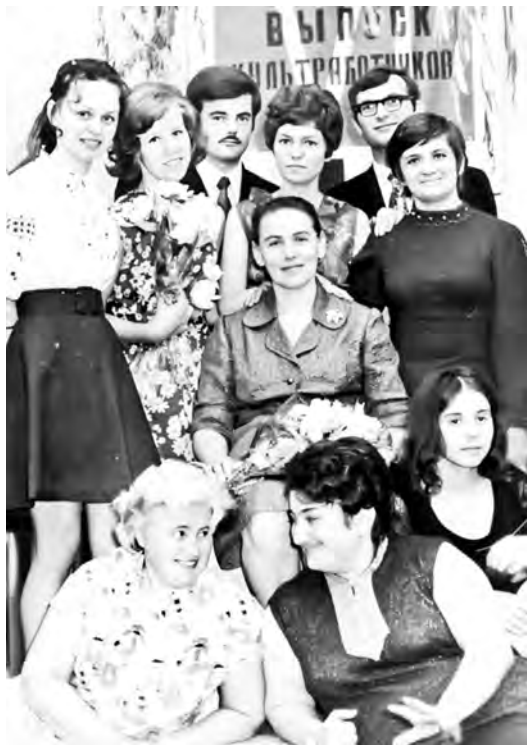
Выпускники 1973 года

тили УТОГ. Как бы переняв от них эстафету, они отдавали себя работе, честно и преданно служили нашему общему делу, название которому — УТОГ. Благодаря нашим педагогам-наставникам и полученным от них знаниям, многие из нас продолжили свое образование, обучаясь в техникумах и вузах.