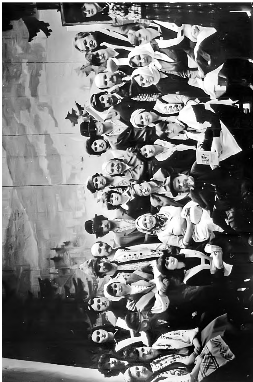
Актеры, занятые в спектакле «Жил-был Иван»