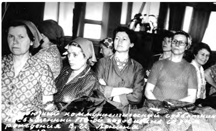
На Всесоюзном субботнике, посвященном годовщине со дня рождения В.И. Ленина. 1956 г.