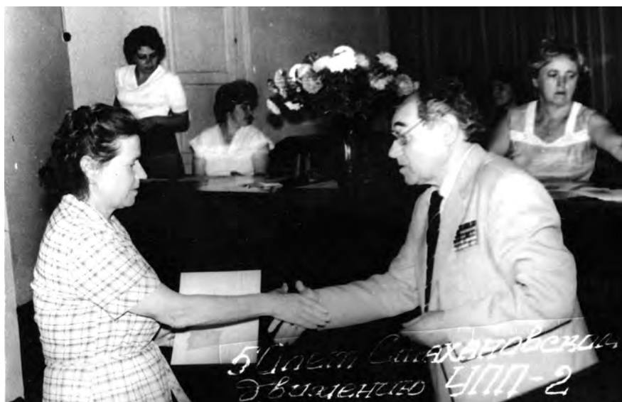
Вручение Почетной грамоты