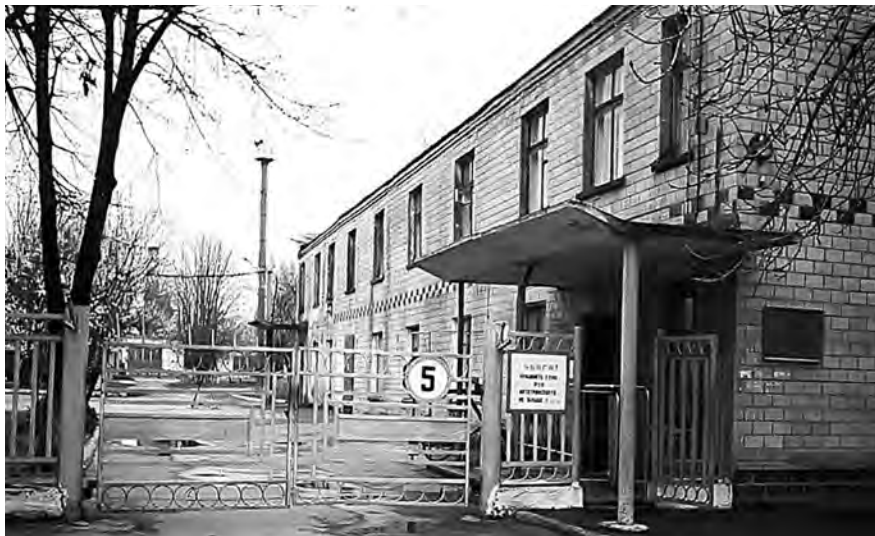
Черкаське УВП УТОГ

Після війни продовжував працювати у Черкаському міжрай-