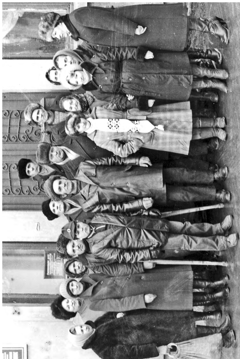
Зліт передовиків сільського господарства, 1983 р.