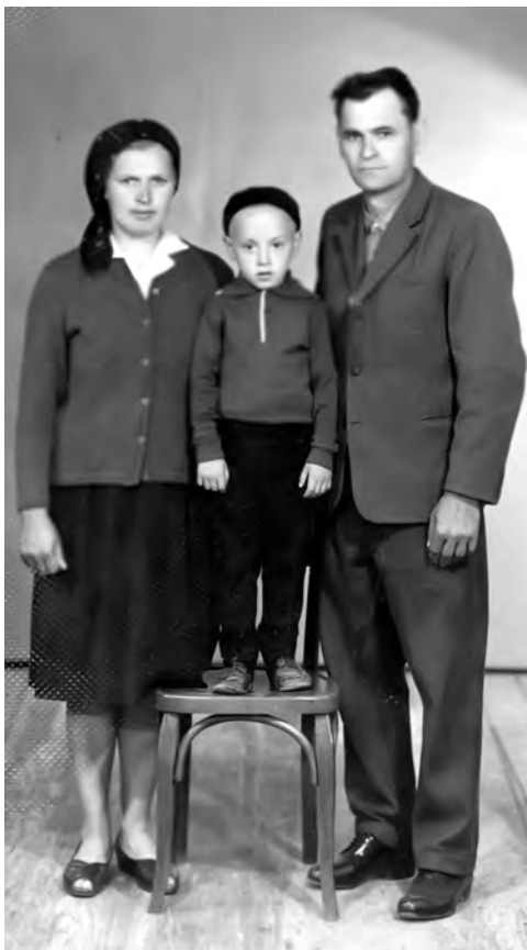
Подружжя з сином

Впродовж 25 років подружжя пропрацювало у колгоспі. Жінка відгодовувала телят, чоловік був пастухом. Дітей змалку привчали до роботи, вони допомагали батькам поратися по господарству, а інколи заміняли їх по роботі у колгоспі. Закінчили сини Сокирницьку середню школу: два здобули професію шофера, а один — столяра. Одружилися, звили свої гніздечка, порадували