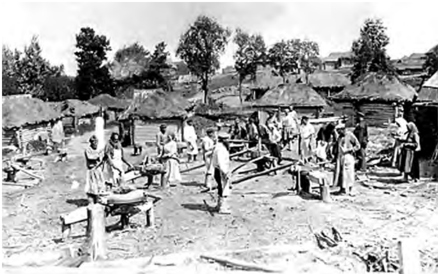
В голодный 1933 год

По ночам шастали бандиты. Грабили, убивали. Забрали у нас корову, некоторые вещи, самих чуть не убили. И дедушка посоветовал нам вернуться в прежний наш дом, в нашу деревню. Собрала мама убогие наши пожитки, связала в узел, и осенью