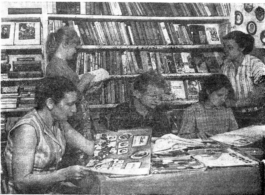
Біла Церква на Київщині. Увечері в бібліотеці міжрайонного Будинку культури УТОГ.