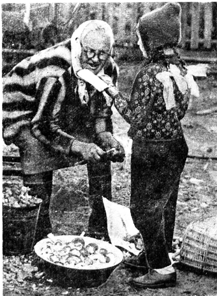
Грибна пора.

М. МЕЛЬНИК. Заступник міністра охорони здоров'я УРСР, головний санітарний лікар республіки.