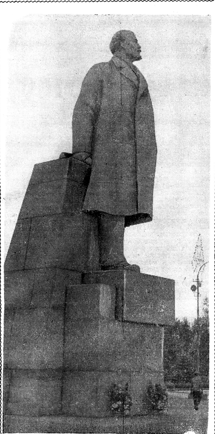
Пам'ятник В. І. Леніну на Куликовому полі в Одесі.

У ювілейному році усі УВП розгорнули боротьбу за гідну зустріч Ленінського ювілею.