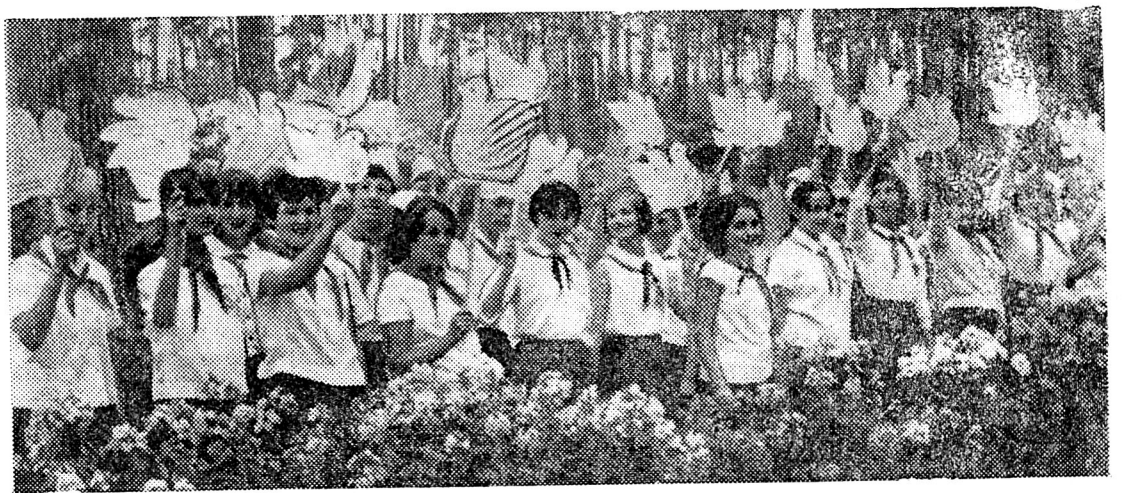
Приліт птахів — щаслива і радісна пора. Нерідко вона перетворюється в справжнє свято дитвори.