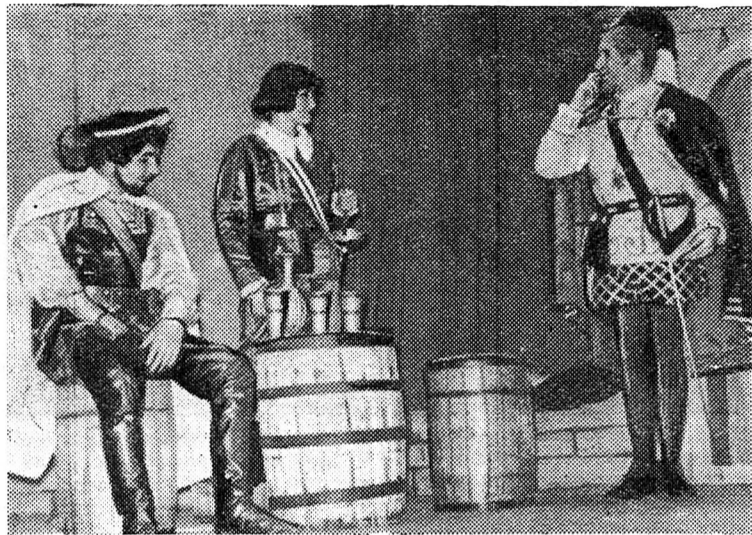
Сцена із п'єси «Тоді в Севільї» в постановці Народного самодіяльного театру.