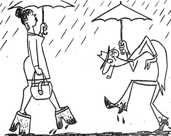
Без слів Мал. Г. Шигодського