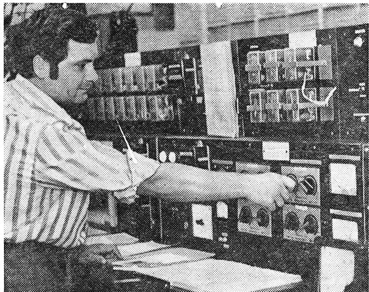
На Донецькому виробничому об'єднанні «Електромагніт» обладнано центральну-заводську лабораторію для випробування магнітних пускачів типу ПМЕ-111 та реле РПУ-2.

Л. СКОРОХОДОВА, інструктор-перекладач. м. Львів.