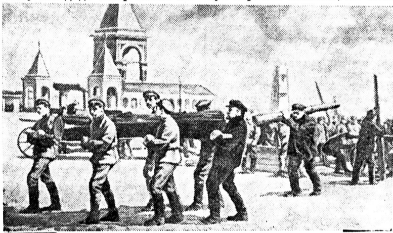
В. І. Ленін на Всеросійському суботнику в Кремлі 1 Травня 1920 року. Картина худ. М. Соколова.