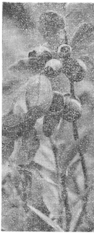
Чорниця — лісова ягода.

ТРОХИ НЕЗВИЧНО , але, виявляється, цілком зручно можна жити і... в музеї. Це підтвердять тисячі львів'ян, чії квартири розташовані на території Львівського державного історико-архітектурного заповідника.