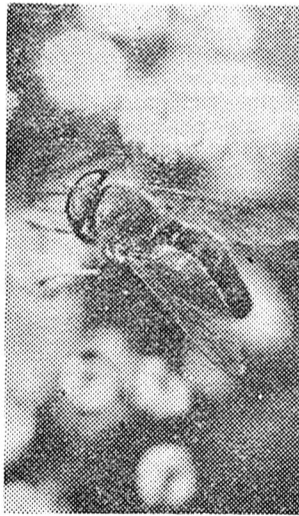
Нектар квіток приваблює всіх.