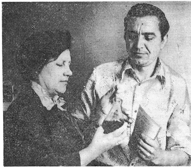
На якість покриття деталей металевих ліжок, що виготовляються на Комунарському УВП, значною мірою впливає певний кількісний набір всіх необхідних компонентів, що входять до складу нікельованих розчинів.