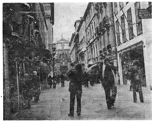
Торгова вулиця в Мілані.

На них ніхто не звертає уваги. Жебраки, бродяги, бездомні. Втративши роботу і надію коли-небудь знову одержати її, вони байдуже проходять мимо шикарних вітрин, ще зранку підшукую-