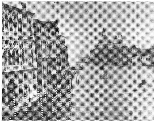
Прогулянка на річковому трамваї по головній вулиці Венеції — Великому каналу.

Досить, напевне, цифр. Не випадково країна прямо таки охоплена безперервними забастовками, протестами робітників, службовців, власників дрібних торгових і промислових підприємств, що ведуть боротьбу проти зuboжіння і безробіття. За даними на 1 січня 1982 року, внаслідок забастовок у 1981 році, Італія втратила 74 млн. робочих днів. Постійно зростає армія безробітних і майже половину її становлять молоді люди віком до 25 років.