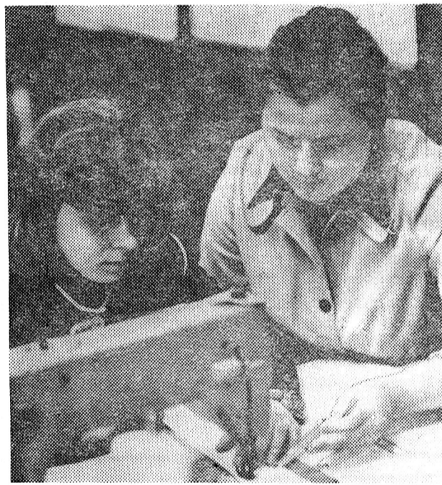
— Спасибі вам, наставники, — ці слова говорять майже всі виробничники, які вперше стають на самостійний трудовий шлях.

Завдяки добре налагодженому виробничому навчанню на Ужгородському УВП-2 значною мірою вирішується проблема кадрів.