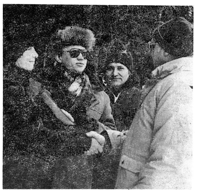
Президент КІС Джеральд Джордан (крайній праворуч) вітає керівника радянської спортивної делегації М. Е. Касьяненко (ліворуч) з блискучою перемогою збірної СРСР.