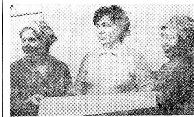
За перший квартал цього року колектив Ужгородського УВП-2 виборов перше місце в змаганні серед підприємств Товариства. Цього досягнуто завдяки злагоженій праці всіх трудівників, високої трудової і технологічної дисципліни.