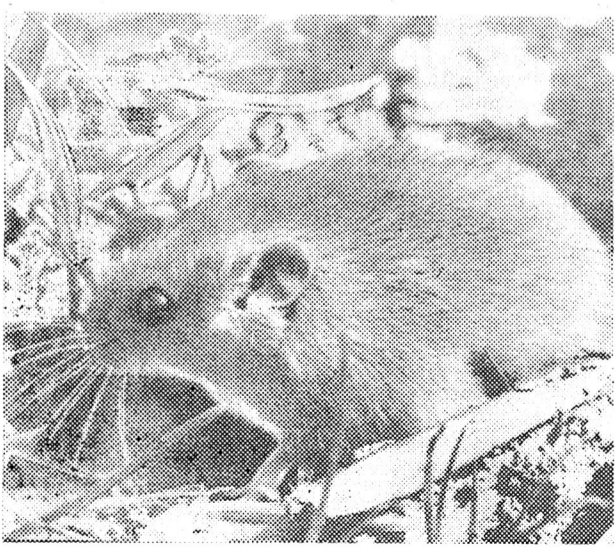
Хороше у лісі! Кого тут тільки не зустрінеш! Цього разу фотооб'єктив зафіксував рідкісну мешканку наших лісів — соню ліщини, яку занесено до Червоної книги УРСР.