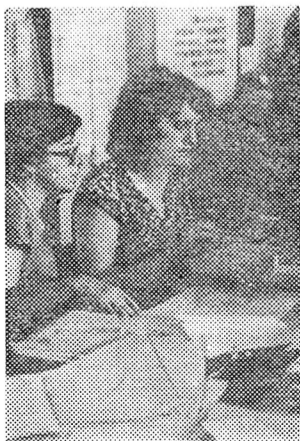
Укладають договори на закупівлю продукції.