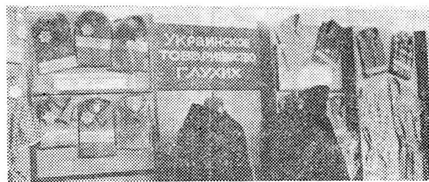
Стенд підприємств нашого Товариства.