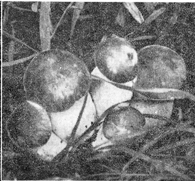
П'ятеро братів — білих боровиків...