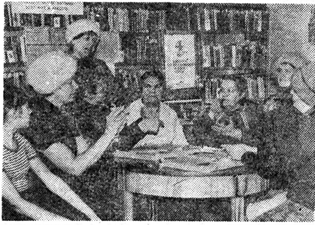
На знімку: під час диспути в клубі на тему: «У чому щастя радянської людини».

Особливо багатолудно у клубі було у переддень виборів до Верховної Ради Союзу РСР. Члени УТОГ з великою увагою вивчали