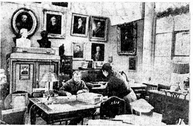
Ленінград. Інститут російської літератури АН СРСР — Пушкінський дім. Тут зберігається і вивчається творча спадщина великого російського письменника.