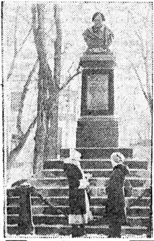
Пам'ятник М. В. Гоголю в парку імені Гоголя в Ніжині. Це — перший пам'ятник письменникові, встановлений у Росії в 1881 році.

тавлена на сцені Александринського театру в Петербурзі, відкрила новий етап в історії розвитку російської драматургії. Письменник, що увійшов в історію театру як творець соціальної комедії, показав всю нікчемність представників поміщицько-дворянського класу, обмеженість їх духовного світу. У повних задушевного гумору поетичних «Вечорах на хуторі біля Диканьки», в героїчному «Тарасі Бульбі», в ліричних відступах у «Мертвих душах» на весь зріст постає Гоголь-патріот. Незгасний інтерес до його творів, втілення створених чудовим майстром слова художніх образів на сцені, на екрані, в музиці та живопису підтверджує велич і значущість М. В. Гоголя.