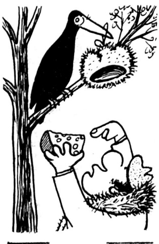
Без слів. Малюнок Г. ШИГОДСЬКОГО.