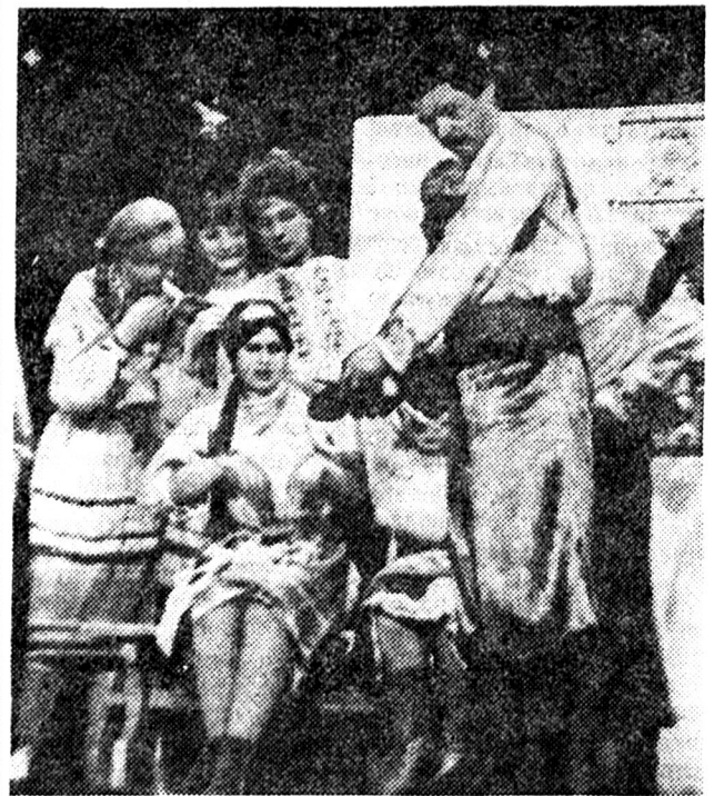
На знімку: сцена з вистави «Ніч перед різдвом».