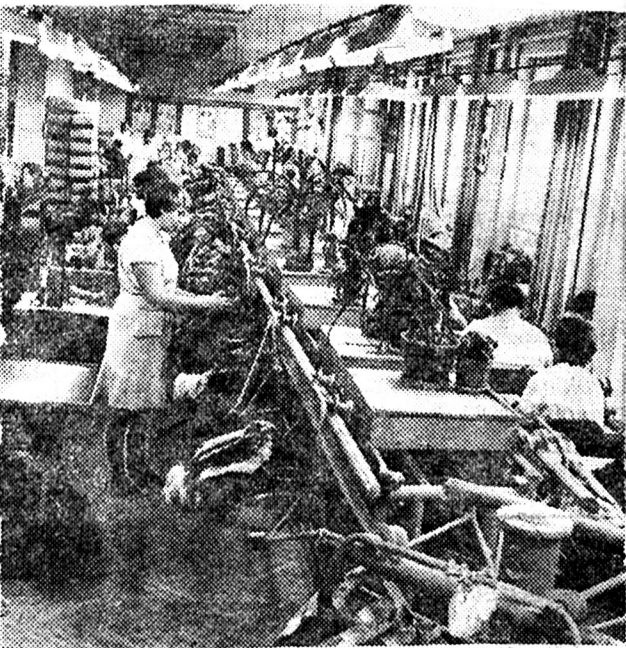
Швейна дільниця. Підвісна лінія поопераційної передачі напівфабрикатів.