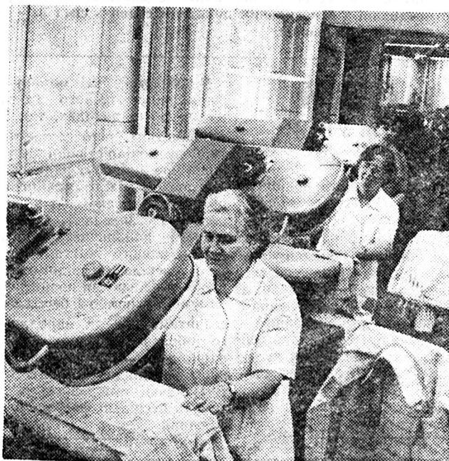
На дільниці прасування готового одягу.