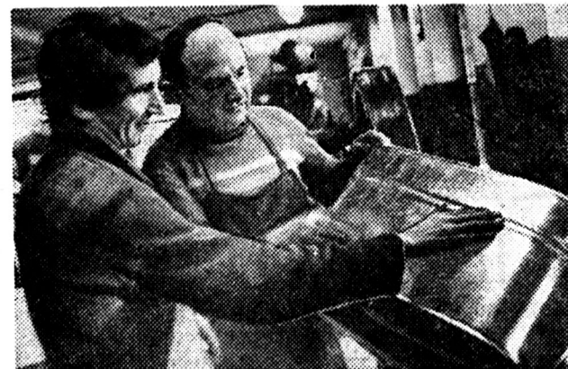
У цеху Гайсинського заводу оцинкованого посуду, що на Вінничині, по-ударному трудиться і група нечуючих.