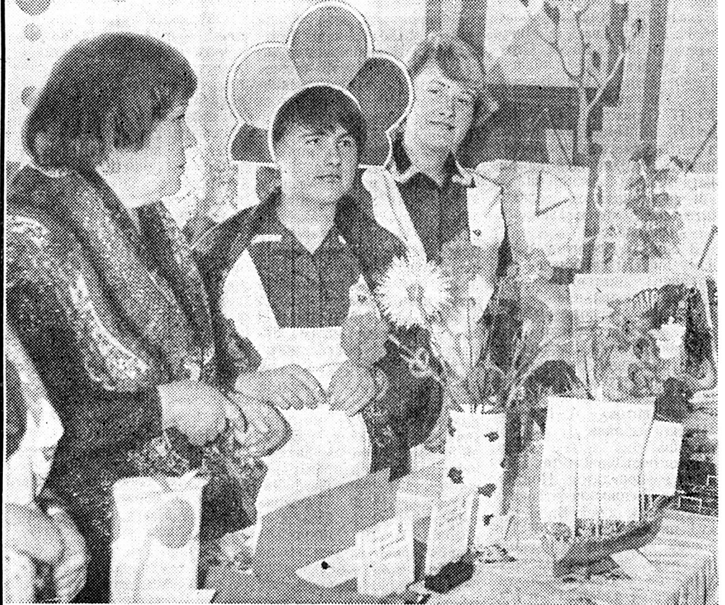
На знімку: один із кіосків ярмарку.