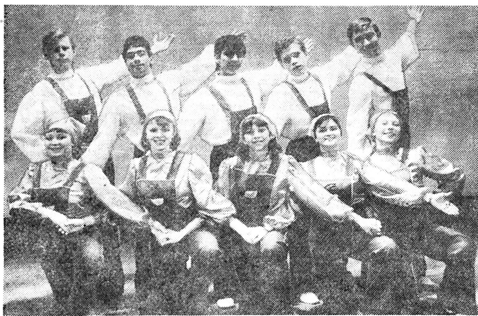
Фрагмент з хореографічної композиції «Слава праці!» у виконанні самодіяльного народного ансамблю танцю «Каблучок» Ворошиловградського будинку культури УТОГ.

Е. ШВАРЦ, мастер спорту СРСР, суддя республіканської категорії. м. Вінниця.