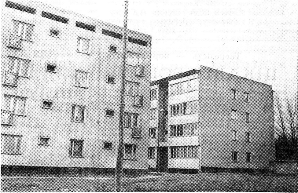
На знімку: будинки, що виростили по Карасарабській вулиці в Ташкенті, часто називають «містечком глухих». Тут знаходяться житлові будинки, Республіканський палац культури, спортзал, дитячий садок, стадіон. Тут же планується спорудження закритого плавального басейну. Текст і фото Г. АЛЕКСЕЄВА.

Бухарі планується будівництво клубів. У мальовничій гірській місцевості наближається до завершення спорудження пансіонату, що може одночасно прийняти 265 відпочиваючих. У цілому обсяг капітальних вкладень на п'ятирічку становитиме 19 мільйонів карбованців—в два з лишком рази більше, ніж було освоєно в період з 1981 по 1985 роки.