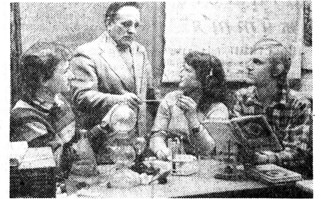
Учніський і педагогічний колектив Ворошиловградської вечірньої школи робітничої молоді для глухих у відповідь на вимоги, які висуває шкільна реформа, домоглися певних позитивних зрушень в організації навчально-виховного процесу.

Е. ГРОЗА, доцент кафедри сурдопедагогіки і логопедії КДП імені Горького.