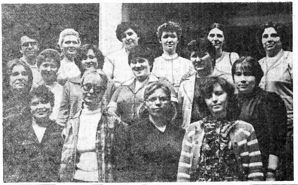
На знімку: члени Товариства, що стали студентами першого курсу заочного відділу КДПІ імені О. Горького. Текст і фото В. ЩЕРБАНЮКА.

У нинішньому році відділом реабілітації при Київському педінституті створено другу групу цільового призначення. На навчання прийнято 25 чоловік.