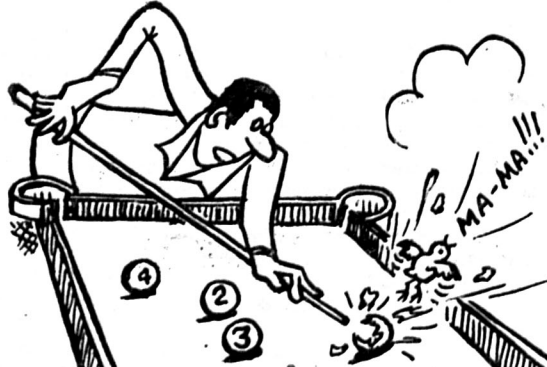
Мал. Г. ШИГОДСЬКОГО.