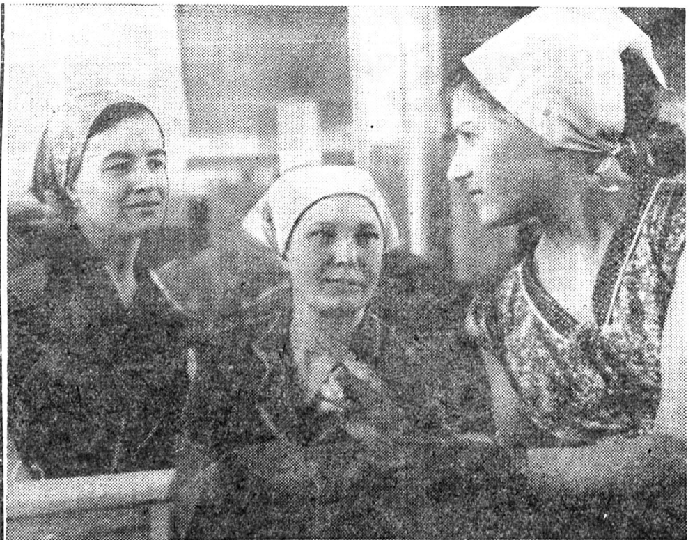
Запорукою успішного виконання виробничих планів і соціалістичних зобов'язань є успішне володіння кожним членом бригади більшістю операцій певного технологічного процесу. Це добре усвідомили в усіх виробничих підрозділах Сумського УВП.

старший інженер з реабілітації Запорізького УВП.