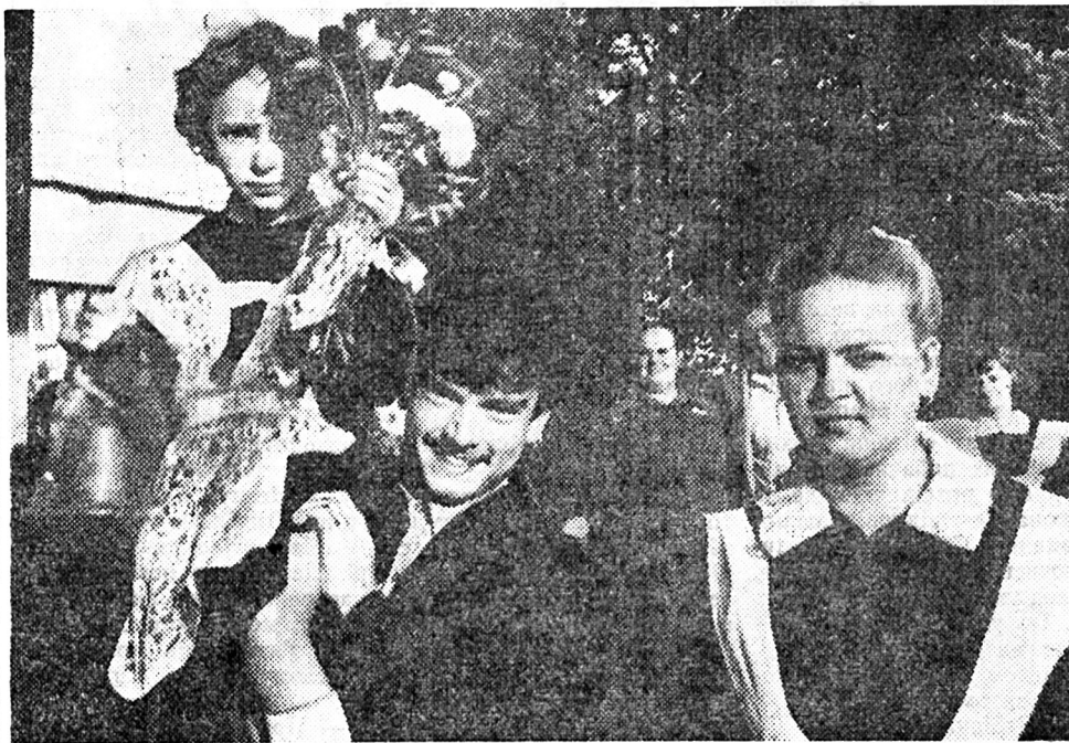
Радісно і урочисто відзначили учні та вчителі День знань у Київській спеціальній школі-інтернаті № 6 для нечуючих дітей.